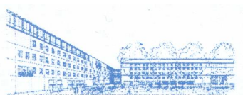
Università degli Studi di Milano Bicocca